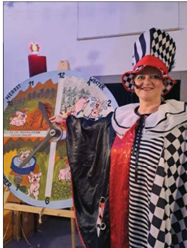
Harlekina vor Ihrer Jahreszeitenuhr

Das Hauptprogramm wird dann an dieser Stelle anknüpfen und die Faschingsgäste können die Rehabilitation der 4 Jahreszeiten begleiten. Die weltpolitischen Geschehnisse werden dann genauso auf die Schippe genommen, wie unsere aktuelle Regierungskrise, der Genderwahnsinn, Geschlechterkampf und Migrationspolitik. Eine Fundgrube für närrische Sketche und amüsante Gespräche. Die Funkgarde des Karnevalsclubs, die Kindertanzgruppe aus Oberschöna und die Dance Boys 4.0 werden das Programm mit ihren Tanzeinlagen perfektionieren.