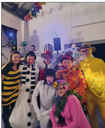
Die 4 Jahreszeiten und ihre närrischen Begleiter

Das Hauptprogramm wird dann an dieser Stelle anknüpfen und die Faschingsgäste können die Rehabilitation der 4 Jahreszeiten begleiten. Die weltpolitischen Geschehnisse werden dann genauso auf die Schippe genommen, wie unsere aktuelle Regierungskrise, der Genderwahnsinn, Geschlechterkampf und Migrationspolitik. Eine Fundgrube für närrische Sketche und amüsante Gespräche. Die Funkgarde des Karnevalsclubs, die Kindertanzgruppe aus Oberschöna und die Dance Boys 4.0 werden das Programm mit ihren Tanzeinlagen perfektionieren.