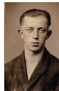
Kurt Baumann

In Oederan nannte man von 1946 bis 1990 eine kleine Straße „Kurt-Baumann-Straße“, die heutige Badgasse. Der Straßennamen damals stand für ein erlittenes Schicksal.