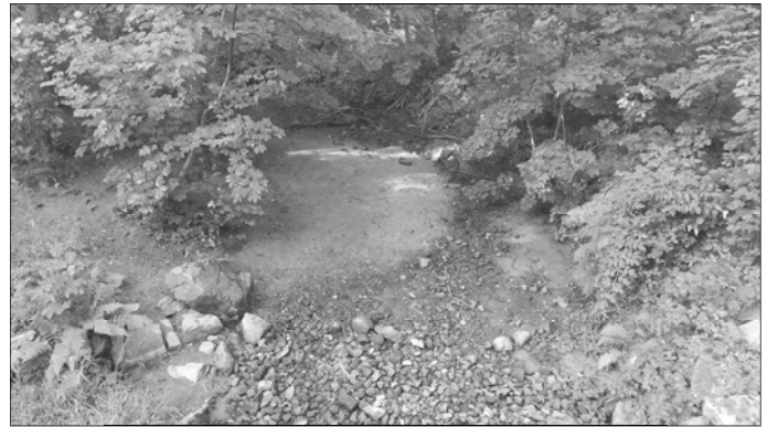
Ein trocken gefallenes Gewässer. Die zahlreichen Strukturen erlauben es den Lebewesen Rückzugsorte zu finden, an denen sie die Trockenphase überdauern können.

Dieser Text entstand in Zusammenarbeit der Fachberaterinnen und Fachberater Gewässer des Landesamtes für Umwelt, Landwirtschaft und Geologie und der unteren Wasserbehörde des Landkreises.