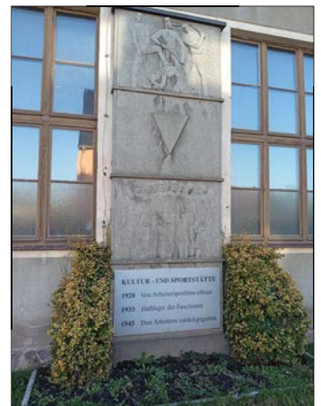
Gedenkstein Flöha-Plaue