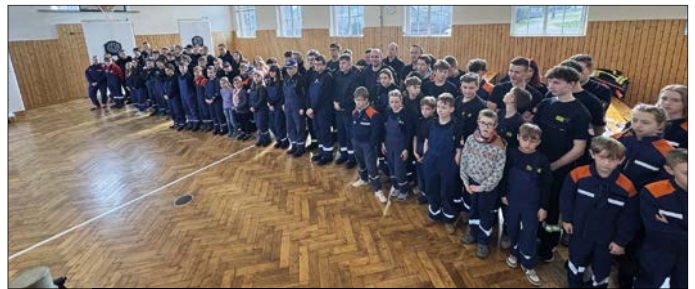
Eröffnungsapell Gemeindejugendfeuerwehr

Alles in Allem eine gelungene Veranstaltung, den Kindern und Jugendlichen hat es viel Spaß bereitet. Sie möchten sich bei allen Helfern im Hintergrund bedanken, die die Sporthalle in eine Dartturnierhalle umformiert haben.