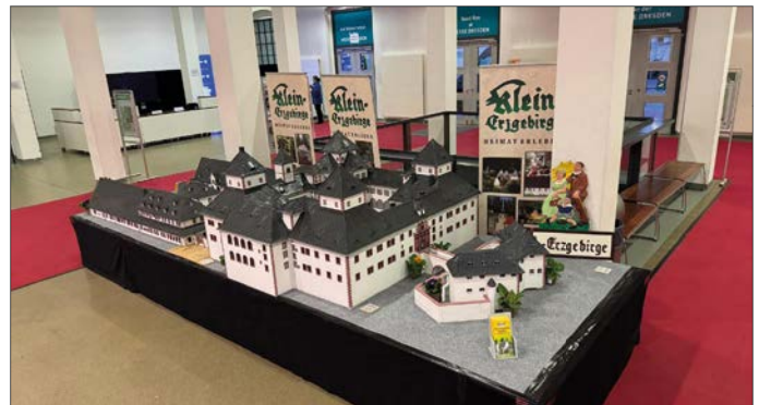
Auf der Messe Dresdener Ostern präsentierte sich der Verein am Eröffnungswochenende mit dem neuen Modell der Augustusburg

Auch während der Saison gibt es jede Menge zu tun, wenn die Natur im Park wieder erwacht und die Bäume kräftig austreiben. Jeden Dienstag treffen sich die Vereinsmitglieder zum Bastelabend. Im Park muss das Unkraut beseitigt und die Bäumchen geschnitten werden. Die Eisenbahntechnik muss gewartet, die Wasserläufe instandgehalten werden und auch in der Werkstatt gibt es immer was zu reparieren oder es wird an neuen Ideen für den Park gewerkelt. Jeder kann mit seinem Talent mithelfen, um den Oederaner Heimatberg auch während der Saison für die Besucher unserer Heimatstadt attraktiv zu gestalten.