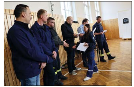
Siegerehrung JF Memmendorf

aus Wingendorf mit 447 Punkten und Börnichen mit 442 Punkten. Den Wanderpokal, gestiftet vom Bürgermeister, gewann dieses Jahr die Jugendfeuerwehr Börnichen mit 751 Punkten, gefolgt von Gahlenz mit 739 Punkten und Breitenau mit 724 Punkten.