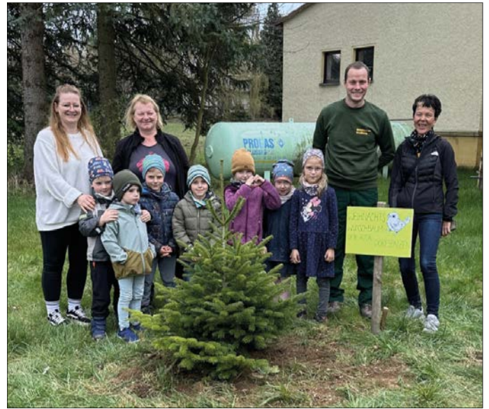
Gemeinsam: Baumschule Freiberg, Verein 600+ e.V. Leiterin und Kinder Kita Dorfspatzen, Agrargenossenschaft Memmendorf

Wir freuen uns auf weitere Unterstützung. Eure Kita „Dorfspatzen“